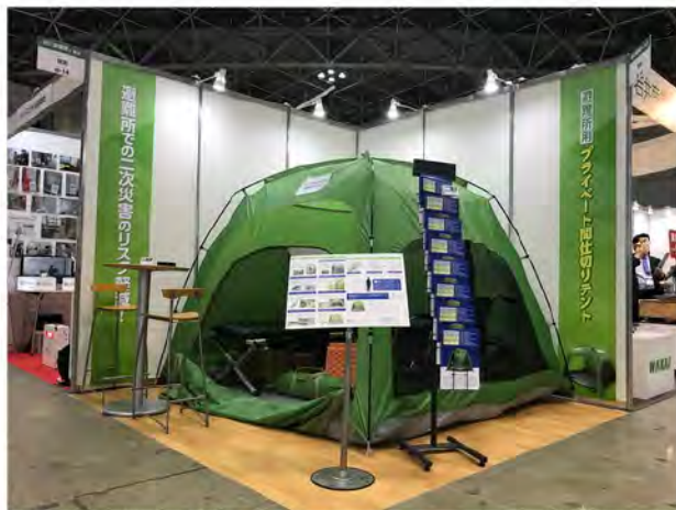
2018防災産業展に出展

本製品は実際に自治体の担当者からのヒアリングを重ね、避難者の肉体的、精神的負担の軽減、プライベート空間の確保、セキュリティー対策、防火対策、衛生対策、感染対策、収納性、汎用性など様々な観点から試作を繰り返して改良してきたものです。避難所での生活環境を考えた基本設計に加え、細かな仕様が施されています。国内アウトドア用品メーカーで生産しており品質管理も確かです。